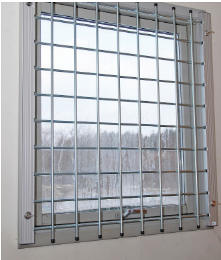
Figur 3: Svingbart gitter

Kontroller at skruer og befæstelser er spændt. Kontroller at kablet ved nødåbningen kører let og ikke er defekt.