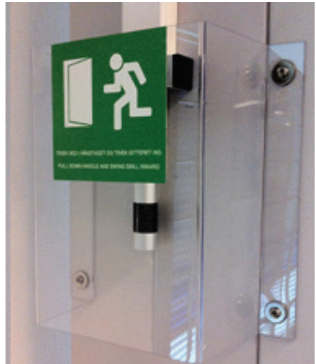
Figur 4: Nødåbning