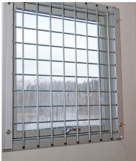
Figur 1: Fastmonteret gitter